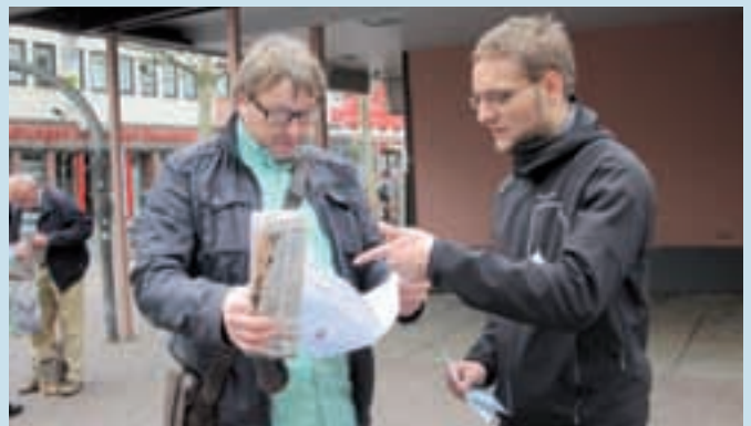
Was genau macht das Kraftwerksforum?

Der Forumsblick informiert über die Arbeit des Kraftwerksforums Staudinger. In der aktuellen Ausgabe geht es vor allem um das Mobile Bürgerbüro des Kraftwerksforums und über die Pilotanlage zur CO 2 -Abscheidung auf dem Gelände des Kraftwerks. Den Forumsblick kostenlos abonnieren können Sie unter www.kraftwerksforum-staudinger.de/dialog