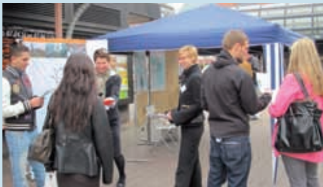
Fragen, Wünsche, Anregungen: reges Interesse beim Mobilem Bürgerbüro

Wann wird mit dem Bau des Blocks 6 begonnen und wann wird er fertig sein? Wäre es möglich, die Blöcke 1 bis 3 länger laufen zu lassen und auf den Neubau von Block 6 zu verzichten? Was ist das zischende Geräusch, das morgens ertönt? Diese und noch viele andere Fragen haben Bürgerinnen und Bürger am Mittwoch, den 6. April 2011, beim Mobilem Bürgerbüro des Kraftwerksforums Staudinger gestellt. Die Antworten auf diese drei Fragen finden Sie auf Seite 2.